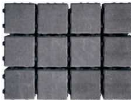
1,5 cm Fuge