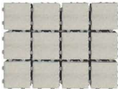
1,5 cm Fuge

10 cm stark, Kanten mit Fasse, mit Abstandshilfen, maschinenverlegbar und verschiebesicher Pflasterstein aus Beton nach EN 1338 – Qualität D I K Oberfläche: Standard (betonrau), Gleit-/Rutschwiderstandsklasse R 13 (USRV-Wert \geq 65 )