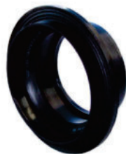
PP-SN 8 - 16