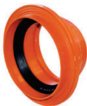
PVC / KG