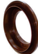
Stzg (BKK-N, BKK-H)