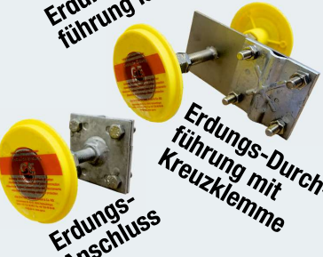
Erdungs-Durchführung mit Kreuzklemme