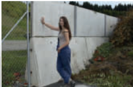
Trennwände für Sand, Splitt, Wertstoffe, Humus, Rindenmulch und vieles mehr.